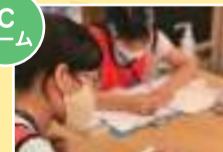
「企画の仕事を独自しゅざい〜キャラグッズのなぞにせまる〜」 花記者(小5)&希美記者(小6)