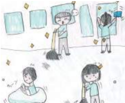
回転ブラシが床をキレイにしながらか動く車「搭乗式床洗浄機」が掃除している様子を動画で見せてもらい、テンション上がりました!

1つ目は、ハンディーそうじきです。ハンディーそうじきは、床をきれいにそうじする道具です。2つ目はマイクロファイバークロスです。マイクロファイバークロスは、ガラスの窓をふく道具で、水でぬらして、よくしぼってふ