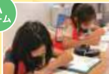
「清掃員さんにインタビュー!」 詩記者(小4)&はのん記者(小4)