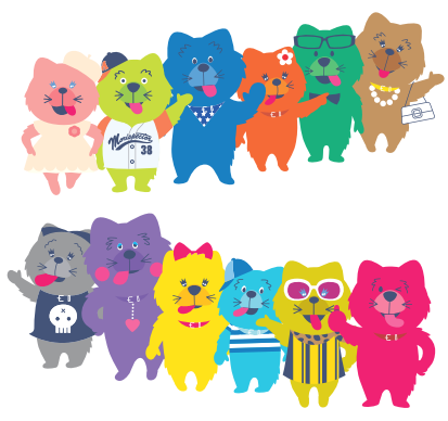
キュースモールのキャラクターたち

キャラクターのひみつについて聞いてみると、なんと、ひみつは「ない」そうです。キャラクター自体がしんぴ的で「ひみつ」のようなそんざいなので、ということでした。私がビックリしたのが、アペーノアペーノというキュースモールのキャラクターは、あべのに住んでいること。アペーノアペーノの仲間たちもあべのに住んでいるらしいです。ちなみに仲間たちは、「実さいはあべのにはいないけど、あべのに住んでいそうな人」をイメージして、キャラクターを考えたりしています。