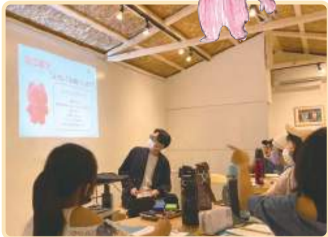
ギャラリー まちマチ(文の里商店街内)