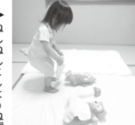
▶ねんねんこしようね。

子育て施設に行き始めたころのパパは少し不安そうで、子どもも緊張した様子でした。回を重ねるごとに慣れていき、パパと子どもがその日のできごとについてうれしそうに話してくれるようになりました。今では、イベント予約のためにカレンダーに予定をぎっしり書き込み、毎日忙しいながらも楽しそうです。「ママも行きかけたな」と言う子どもが「また今度ね」と言って慰めてくれます。