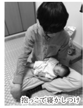
抱っこで寝かしつけ

私は2019年5月から同年11月末まで育児休業を取得しました。娘が生後1か月半ごろから8か月ごろまでです。その中で私自身が感じたこと、体験したことを書いていきます。これから育児休業を取得しようとしている方や、取得を悩んでいる方への一助になれば幸いです。 ただし当時は新型コロナウイルスが流行する前でしたので、現在とは社会情勢が大きく異なっています。我が家での一事例として読んでいただければ、と思います。