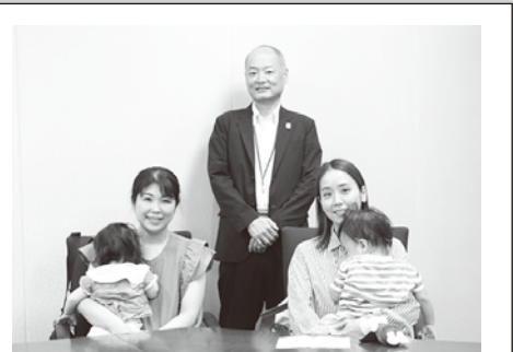
青柳区長と一緒に記念撮影！

令和6年4月に新しく就任された阿倍野区の青柳毅区長ってどんな方？阿倍野区の子育て環境や施策について、1歳の子もたちと一緒にインタビューしてきました！