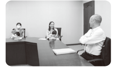
▲終始にこやかにお話ししてくださいました