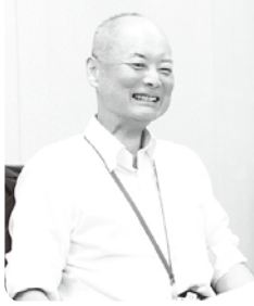
▲ご自身も子育て中の青柳区長