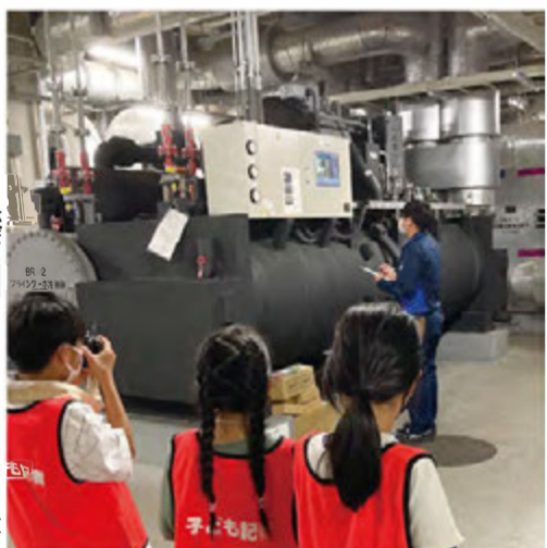
▶館内を冷房するための冷水と氷をつくる機器『ターボ冷凍機』

あべのキューズモールでは、屋上から地下2階までたくさんの機械が24時間動いています。設備員さんたちは、毎日、安全のために点検や修理をしてくれています。見たことのない大きな機械や、いろんな道具を見せてもらいました!