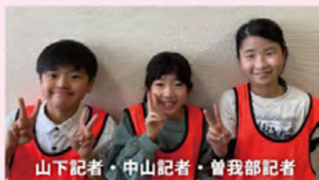
山下記者・中山記者・曾我部記者