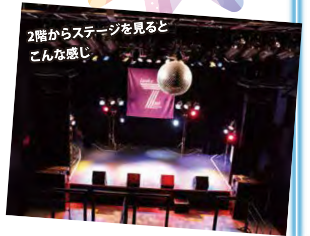
2階からステージを見るとこんな感じ

今回私たちのためにライブハウスの中のステージでスモークを出してくれました。スモークは、においもなく、すつても大丈夫な白いけむりです。