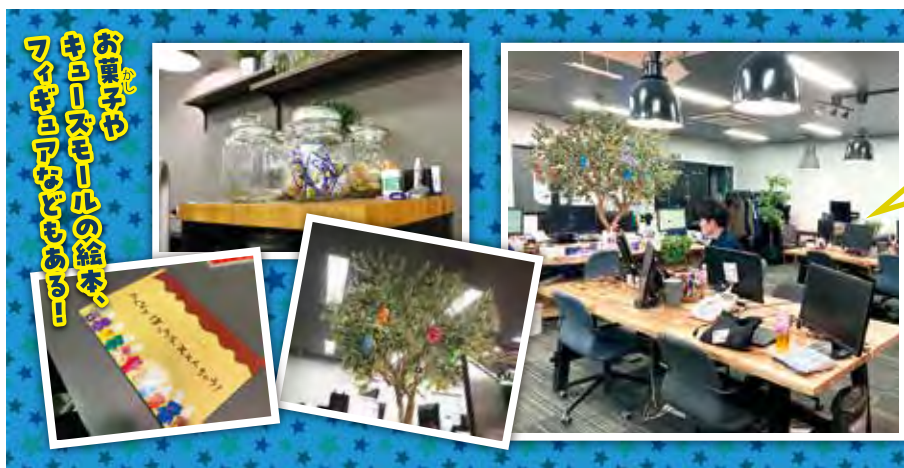
お嬢ちゃん キューズモールの絵本、 フベコロパピオのカラー