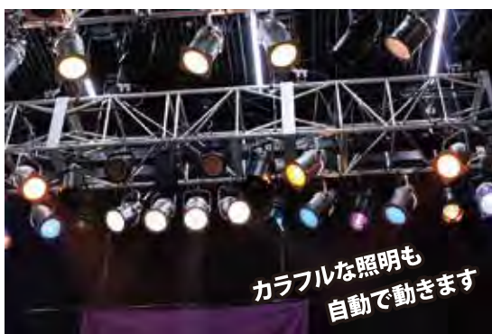
カラフルな照明も自動で動きます