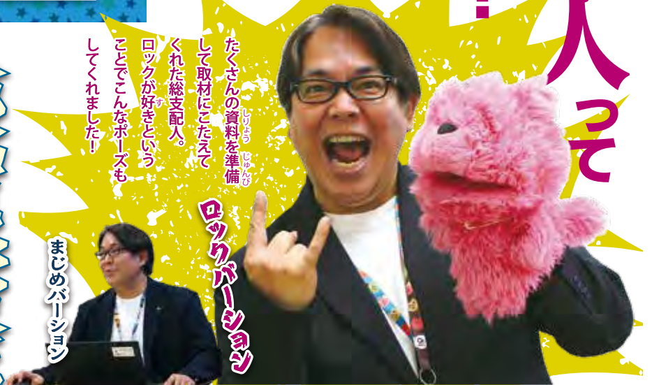
ロックガールズちゃん