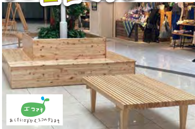
▲間伐材を活用したベンチ。2階にあるのでぜひ座ってみてください！