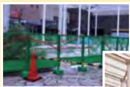
◀5月には工事中でしたが...

7月に、キューズモール4階に芝生の広場が誕生! その広場のまわりにも新しいお店もでき、ピクニックなども楽しむことができます。オープンが待ち遠しいですね!