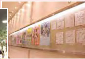
▲あべのキューズモールでイベントをしたアーティストのサインやポスターが飾られているよ。どこにあるか知ってるかな?