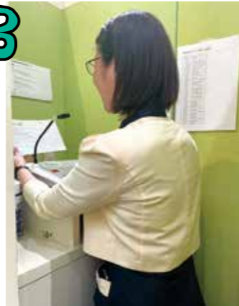
▲館内放送のブース

インフォメーションでの相談は何か多いかが気になってTOP3を調べてみました。聞いてみると、1位は落とし物・忘れ物の相談で、2位はお店の場所を探す相談、3位はポイントカードの入会のための相談です。 落とし物・忘れ物が多い日で1日100件くらいのごきせ。